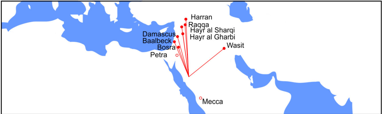
Above: Mosques that point between Mecca and Petra 87 -155 AH