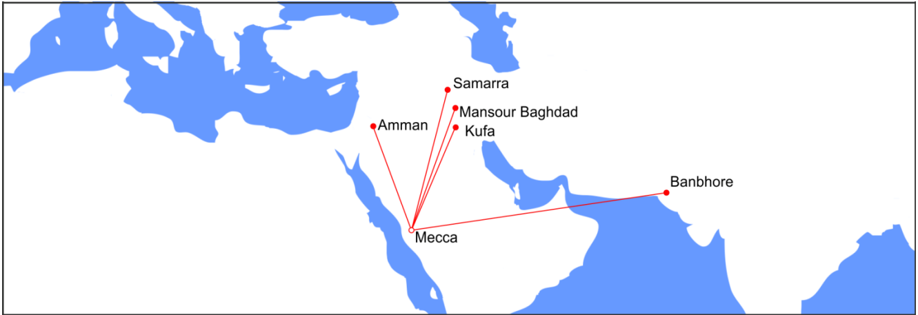
Above: Mosques that point to Mecca where we can still determine their original Qibla direction 109-245 AH.